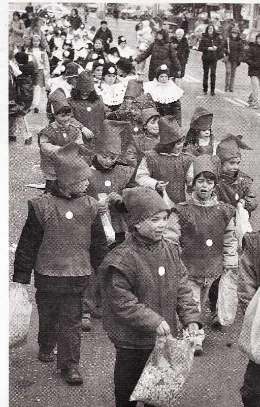
Una delle scolaresche mentre sfilata lunedì mattina