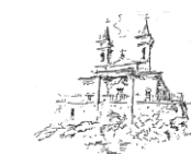
Da: PASSEGGIATE NEL CANAVESE di BERTOLOTTI Tipografia di F. L. Curbis 1870

COSSATERA, COSSATÉ , l'Ordine del Fiore di Zucca, ed i rappresentanti del comitato carnevalesco si recano in visita alla Comunità Cristiana di Banchette.